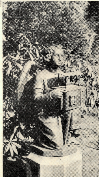
Engel auf dem Stöckener Friedhof in Hannover, welcher dem Kasseler-Engel als Vorbild diente.